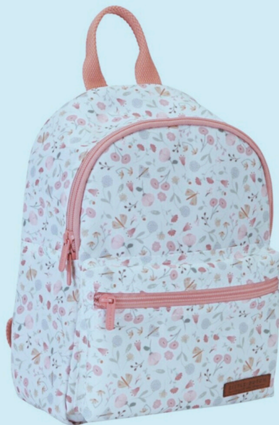
Flores y Mariposas

La mochila de Little Farm es perfecta para la escuela o visitas familiares. Es eco-friendly, fabricada con material reciclado de botellas de plástico. Tiene asas ajustables con un cinturón en el pecho, bandas elásticas para la botella de agua, un compartimento para obras de arte y una etiqueta para el nombre y dirección del propietario.