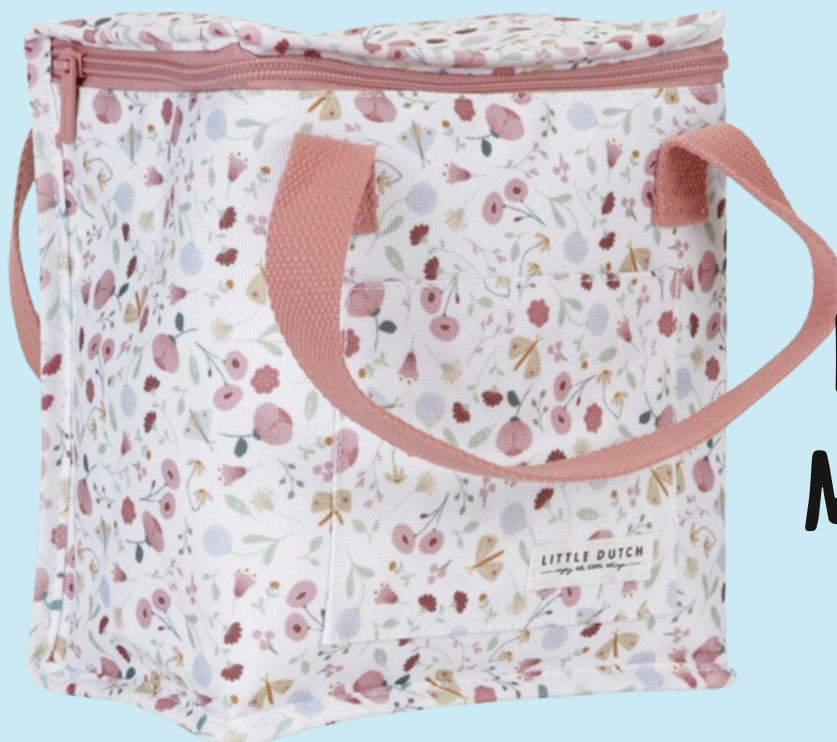
Flores y Mariposas

¡Embárcate en una aventura con esta divertida bolsa de almuerzo de diseño Little Farm! Hecha de lona resistente y con aislamiento, mantiene frescos tus alimentos y bebidas. Su compartimento principal es amplio para una caja de almuerzo y una fruta, mientras que el exterior permite guardar una galleta. El asa facilita su transporte.